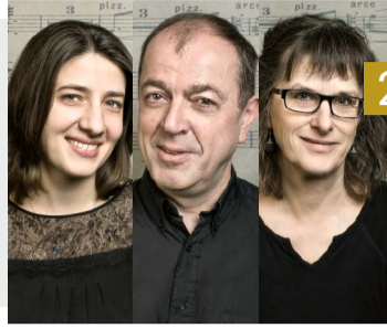
2 Adieu Wir nehmen Abschied von drei Lehrpersonen