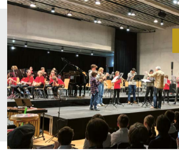
3 Grosses Ensemblekonzert Im Saal Gartenhof